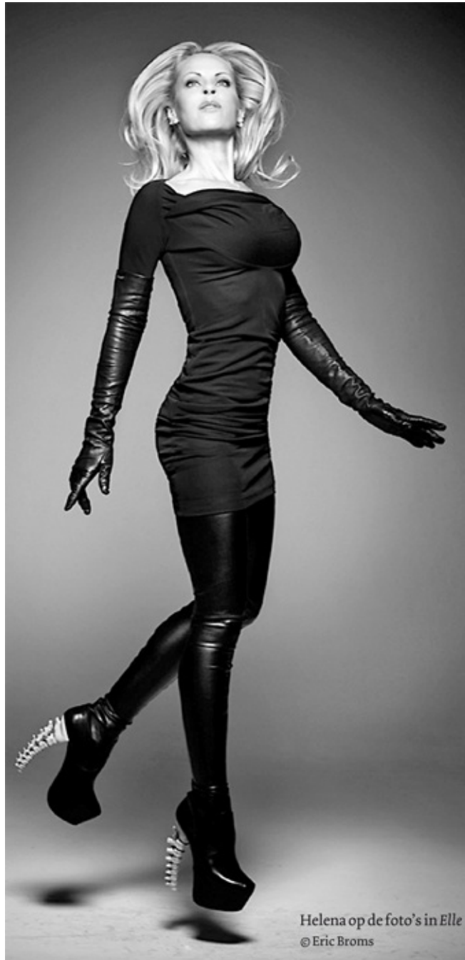
Helena op de foto's in Elle