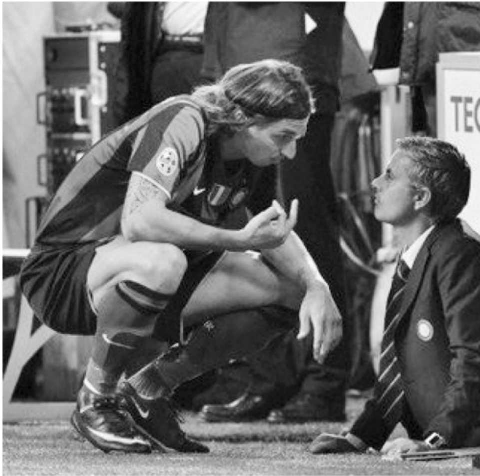
Met José Mourinho