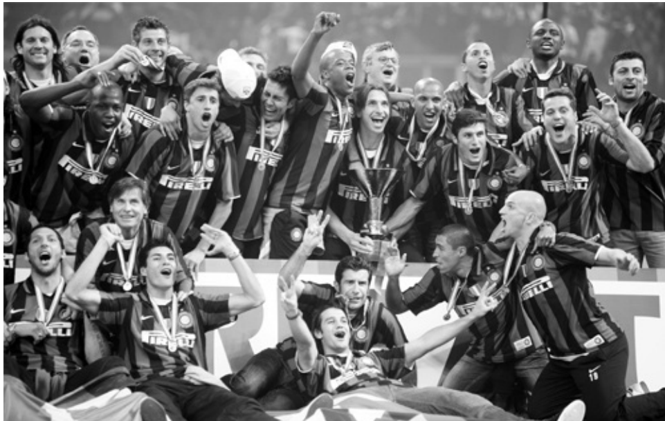
Kampioen met Inter