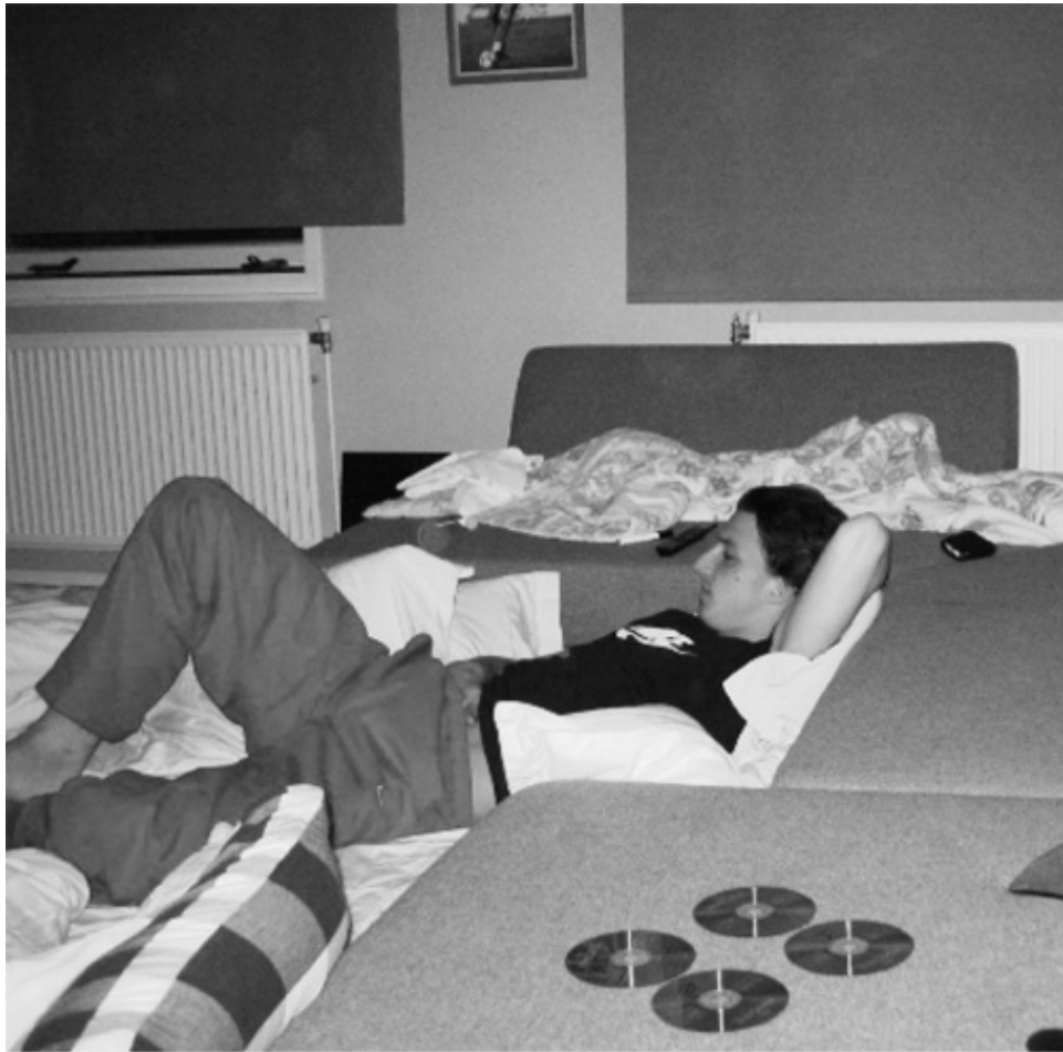
In mijn rijtjeshuis in Diemen