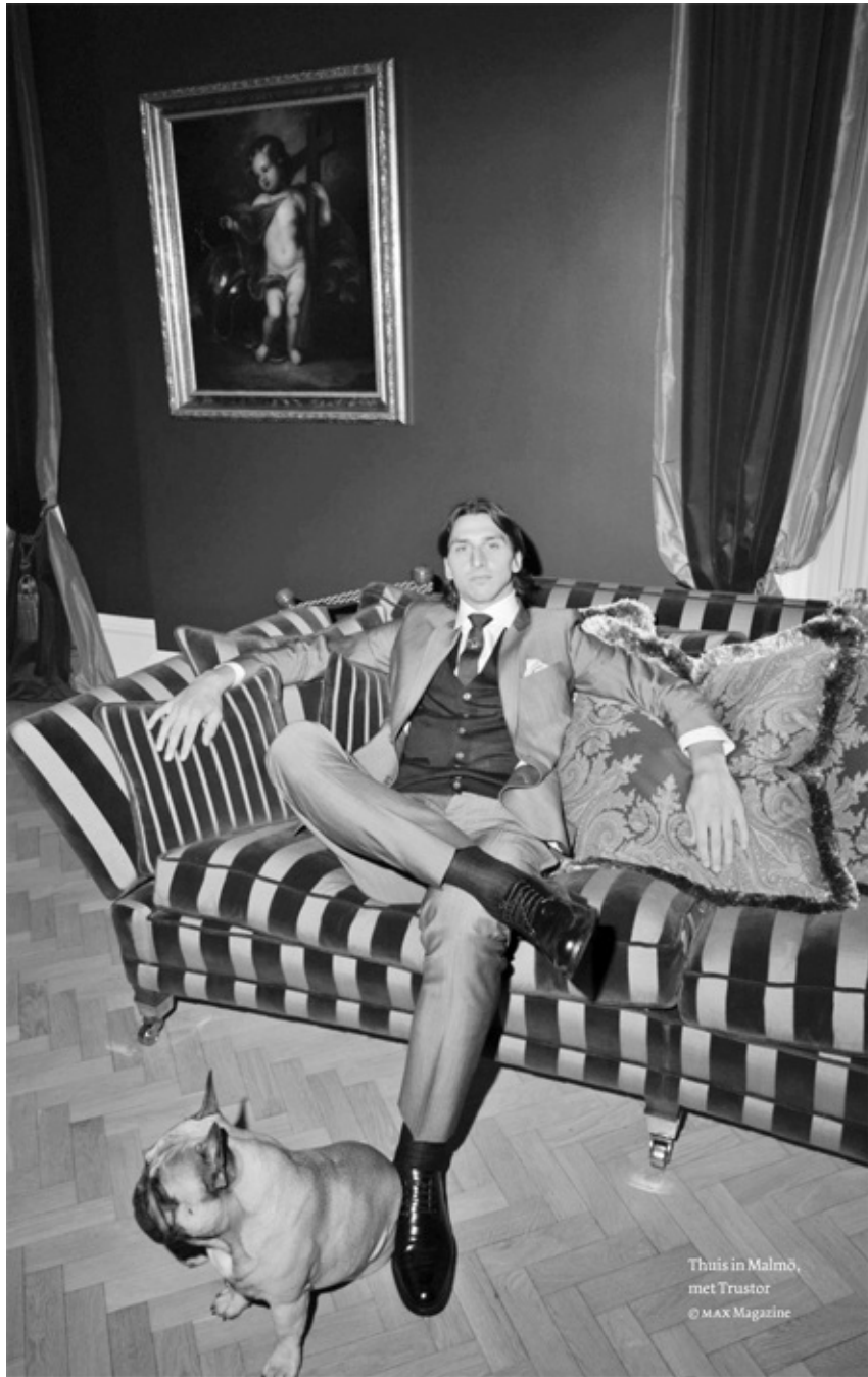
This is in Malmö, met Truster