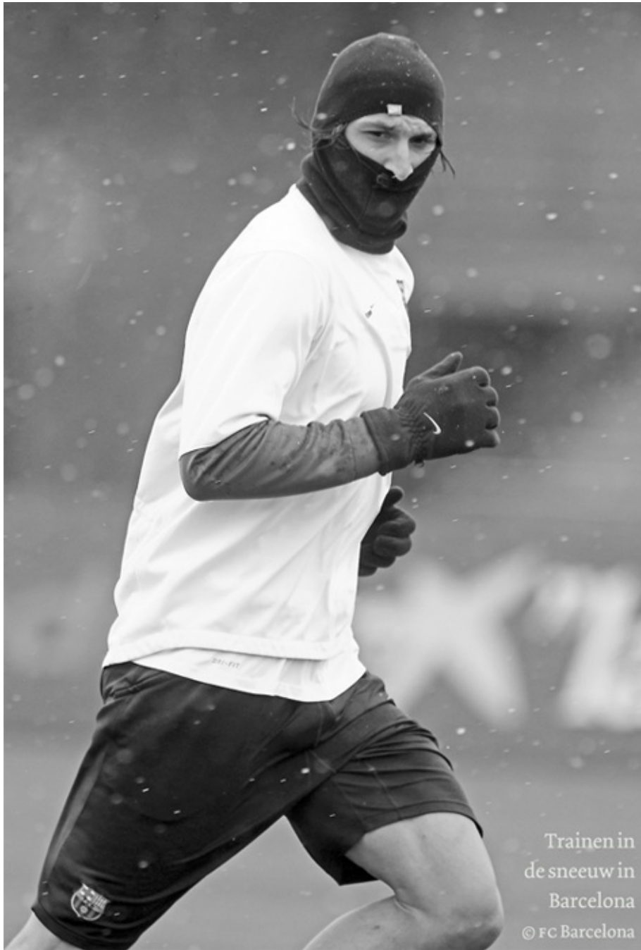
Trainen in de sneeuw in Barcelona