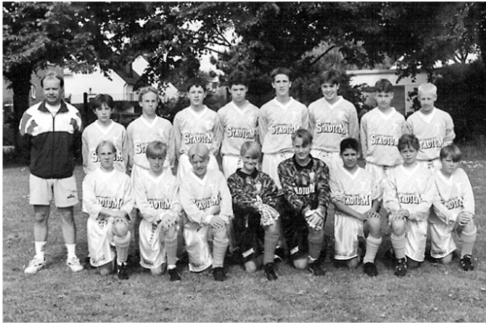
Jongensploeg van Malmö FF