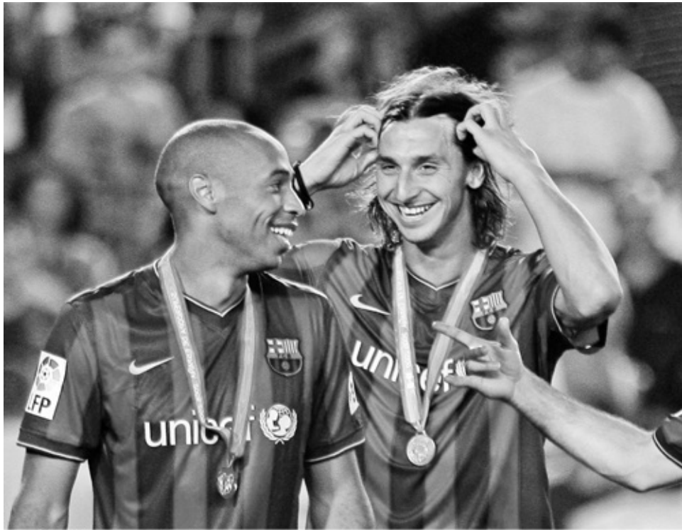
Met Thierry Henry in Barcelona