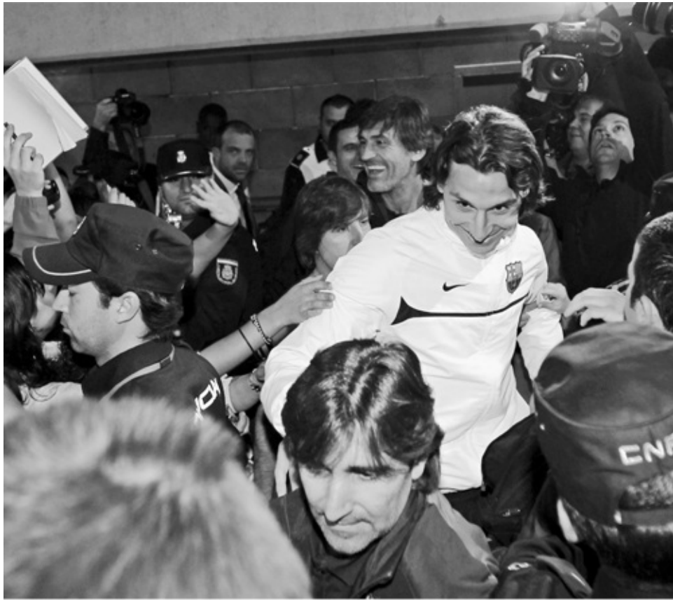
Aankomst in Barcelona