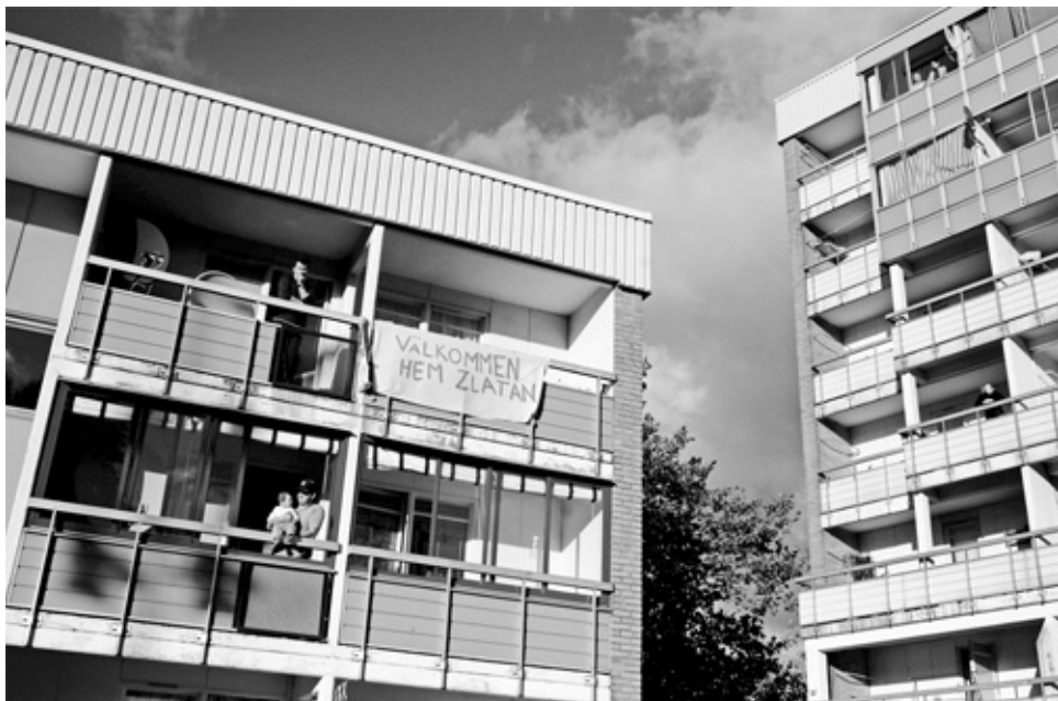
WELKOM THUIS, ZLATAN