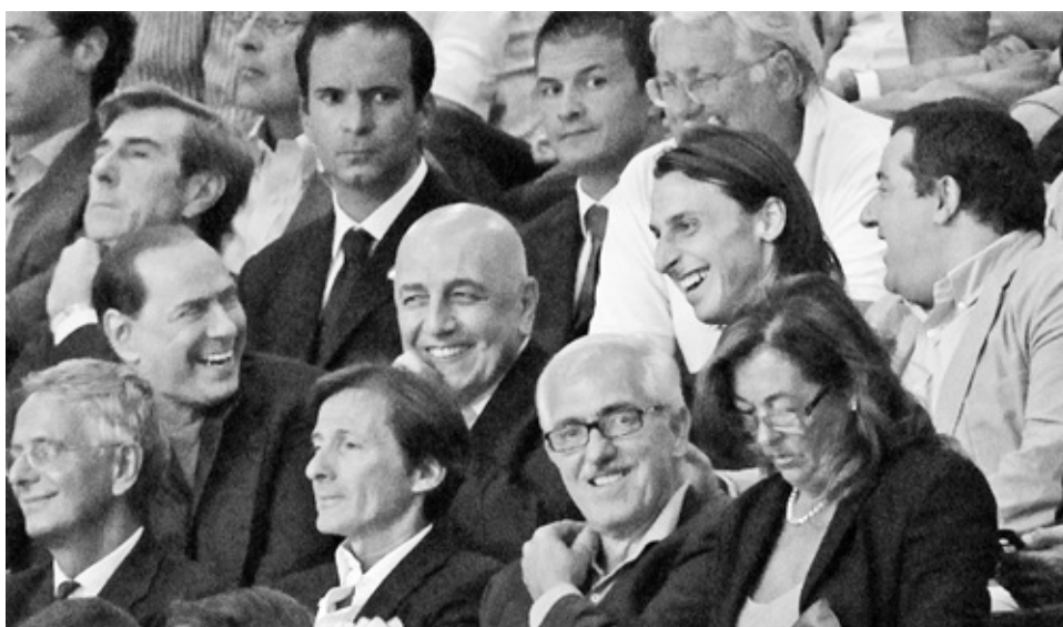
Op de tribune met Berlusconi, Galliani en Mino