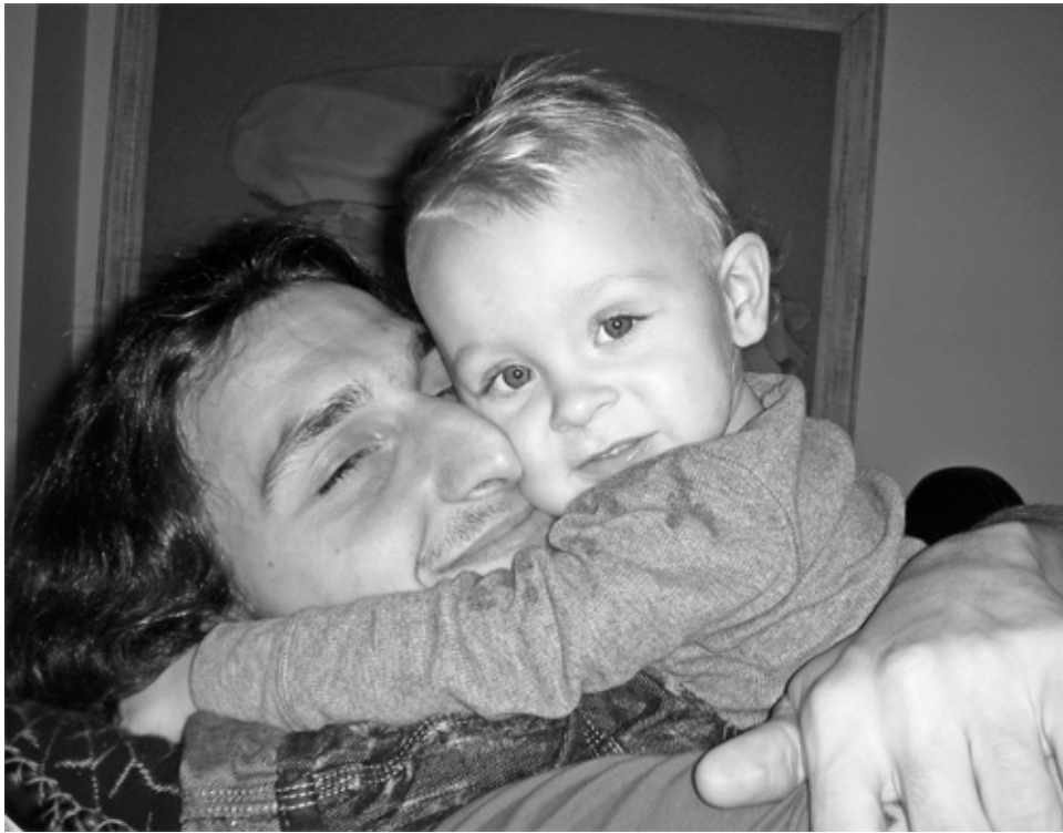
Terug in Milaan: Mino, Vincent, Maxi en ik