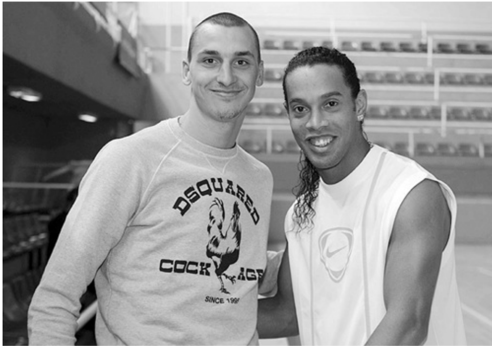
Met Ronaldinho