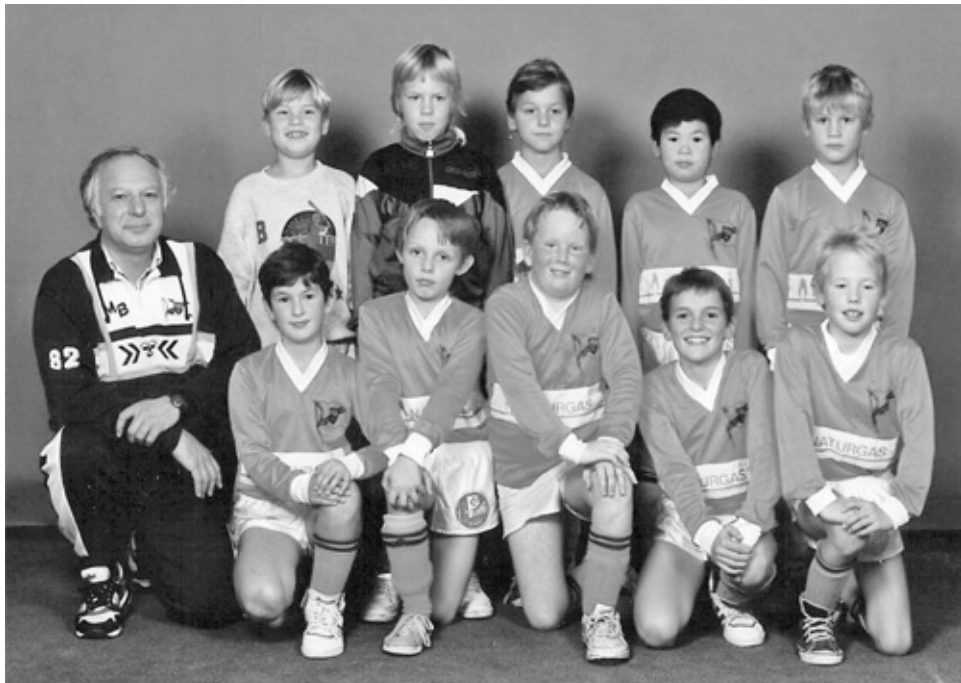
Jongensploeg van MBI