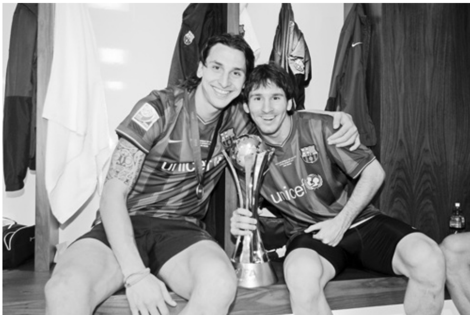
Met Messi bij Barcelona