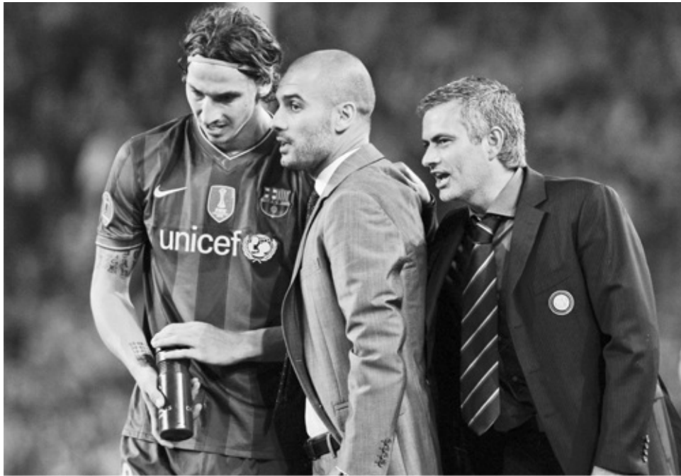
Mourinho duikt opeens achter Guardiola en mij op in de halve finale van de Champions League