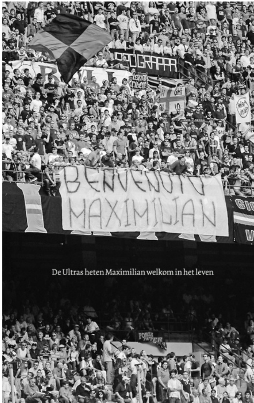
De Ultras heten Maximilian welkom in het leven